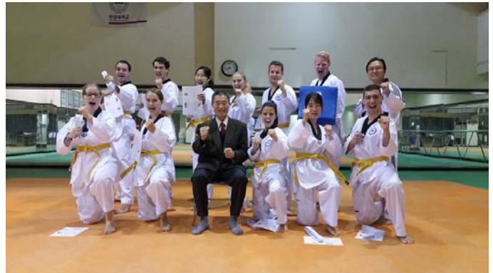
Mit den Taekwondo Hereos zu Besuch bei Kukkiwon, erfolgreicher Abschluss des gelben Gürtels

Ansonsten gibt es immer noch einen Tag, an dem sich alle Clubs an der Hanyang University vorstellen. So bin ich dann zum Beispiel noch dem Schwimmclub zugetreten. Es kostet immer einen kleinen Mitgliedsbeitrag aber dafür wird einem echt viel geboten. Es gab drei verschiedene Level: Beginner, Fortgeschritten und Profis und dann sind wir jeden Samstag schwimmen gegangen. Die Leute aus dem Schwimmclub sind alle total nett und offen und es ist super wenn man ein paar Koreaner kennen lernen möchte. Man geht immer zusammen nach dem schwimmen essen und trinken, es gibt Snacks umsonst vor den Prüfungen und man kann am Membership Training teilnehmen. Nur zu empfehlen!