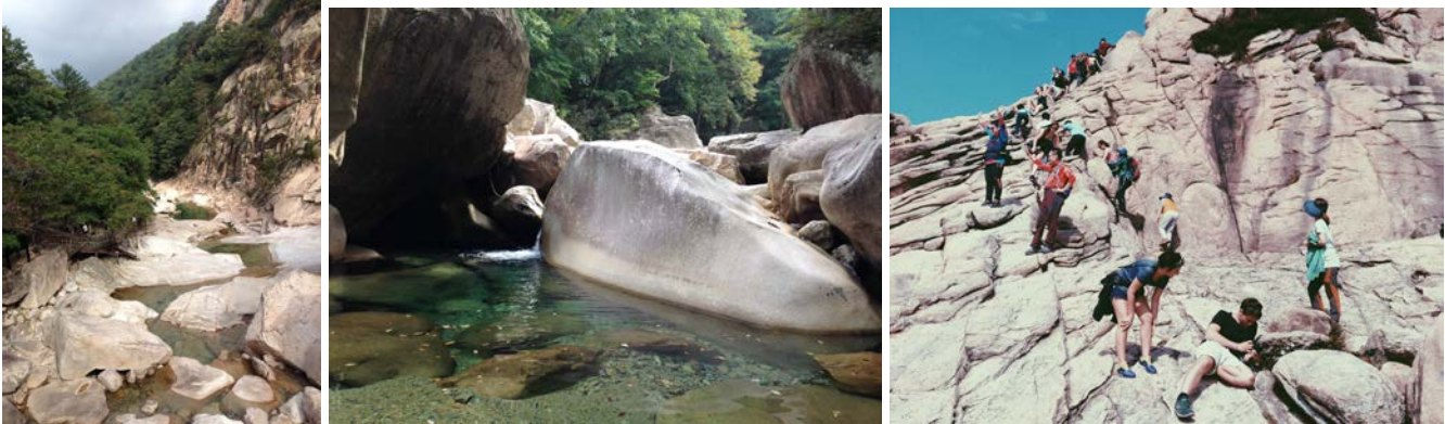
Seoraksan National Park in der Nähe von Sokcho

Am wenigsten gefallen hat mir die Anwesenheitspflicht weil ich dadurch letztendlich sehr wenig reisen konnte.