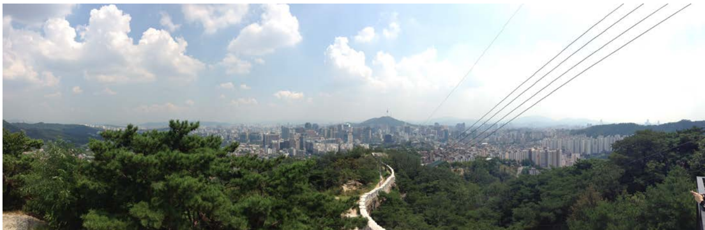
Blick vom Bugaksan Mountain mitten in Seoul

“Annyeong haseyo” (안녕하세요, auf deutsch: „Guten Tag“), wenn du dir ein Auslandsaufenthalt in Seoul, Korea vorstellen kannst, dann sollte der folgende Bericht hilfreich für dich sein.