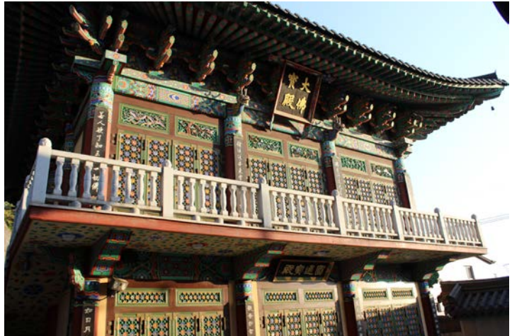
Teezeremonie bei einem Eintages-Ausflug nach Namyangju, Myogaksa Tempel bei einem Templestay Aufenthalt

Öffentliche Verkehrsmittel ist die Metro super! Die Student-ID von der Hanyang University ist eine T-Money Karte und mit der kann man für wenig Geld (1,250 Won pro Fahrt) überall hin fahren. Die T-Money Karte selber kostet ansonsten (wenn man die Student-ID noch nicht hat,) nur 2,000 Won und ist in jedem Convenience Store (24/7 offen) erhältlich. Man kann auch einfach ein normales Einzelfahrtticket kaufen, das ist dann aber ein wenig teurer. Ansonsten für nachts kann man sich ein Taxi nehmen, gerade wenn man sich aufteilt sind die auch nicht wirklich teuer.